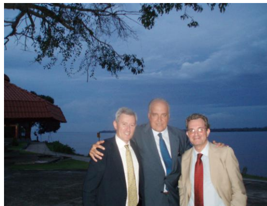
Ponentes españoles con el Embajador y Consejero de Educación