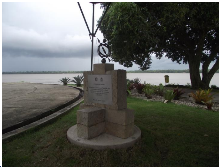
Monumento a Orellana