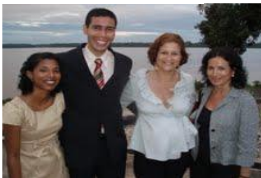
Equipo Centro de Recursos Didácticos de Español de Belém