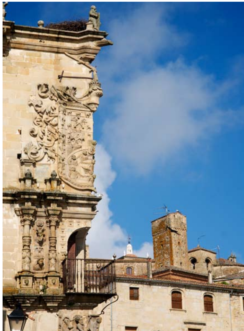
Sobre estas líneas, busto de Francisco de Orellana en su localidad natal y Palacio del Marqués de la Conquista (siglo XV). A la derecha al fondo, iglesia de Santiago, erigida en el siglo XIII.

E l Año Orellana, sancionado por las más altas instancias del país, pretende ser algo más que el recordatorio de una figura algo empolvada (¡hubo tantas!) de la epopeya americana. Pretende un enfoque universalista, global en el mejor de los sentidos. El río que descubrió Orellana, el Amazonas, y su extensísima cuenca –el pulmón verde más dilatado del planeta– están en peligro. Aún siguen existiendo tribus no contactadas, cierto, pero la mayor parte del territorio se ve amenazado por madereros, petroleros, misioneros, ingenieros de Caminos y pescadores de río revuelto. El Año Orellana, por tanto, debería hacer hueco entre fastos y banquetes para tres cosas: recordar al personaje, sí, pero también potenciar su ciudad como reclamo turístico y, sobre todo, concienciar a todos de que somos parte de la aventura y responsables del planeta.